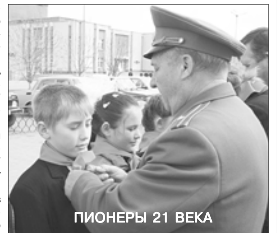
ПИОНЕРЫ 21 ВЕКА

Особая тема в истории пионерии - Великая Отечественная война. Дети и подростки вынесли тяжелейшие испытания тех лет наравне со взрослыми. Помогали в госпиталях. Работали на заводах и в колхозах. На занятой врагом территории пионеры, не щадя своей жизни, участвовали в подполье, воевали в партизанских отрядах. Так было и на Белгородчине. Пионеры были в партизанских отрядах Белгородского и Шебекинского районов, в Мья-