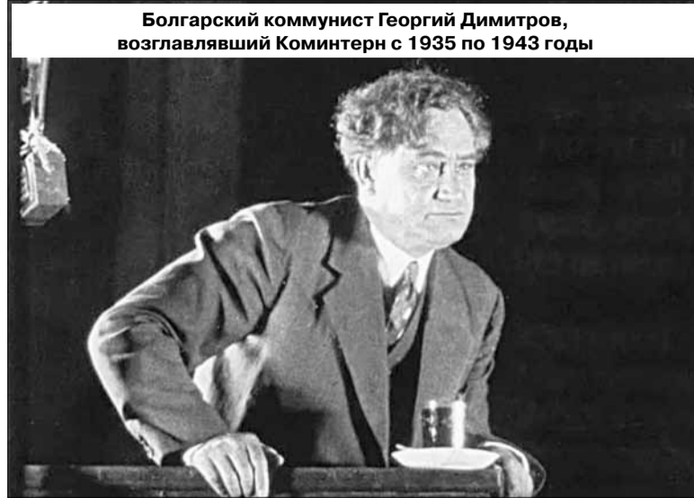
Болгарский коммунист Георгий Димитров, возглавлявший Коминтерн с 1935 по 1943 годы

И после Великой Октябрьской социалистической революции, в марте 1919 года, по инициативе В.И. Ленина был создан 3 Интернационал, объединивший партии,