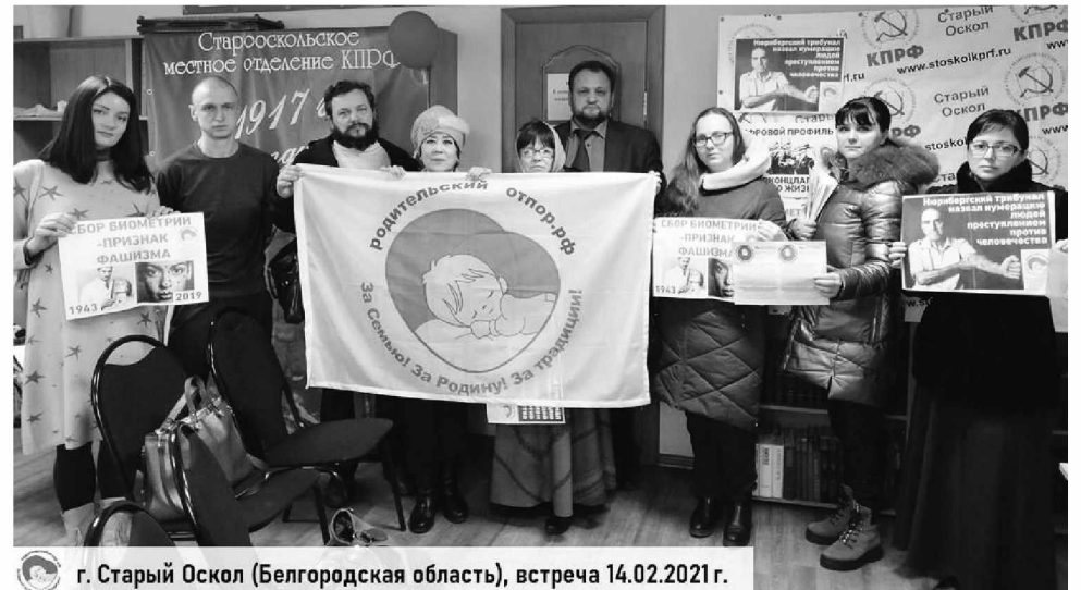
г. Старый Оскол (Белгородская область), встреча 14.02.2021 г.

стить окончательной утилизации нашего образования и развращения детей через социальные сети. Движение «Родительскийотпор.рф» уже более 10 лет успешно борется с насильственной цифровизацией во всех сферах и выступает за запрет социальных сетей в детском возрасте. Активистам движения за десятилетие борьбы за права семьи удалось отбить множество поправок в законодательство, направленных на уничтожение традиций, семьи ювенальными технологиями, нравственности и традиционных семейных ценностей. В ряде регионов созданы постоянно действующие отделения родительского отпора для своевременного реагирования и обсуждения общей стратегии защиты прав семьи. Десятки незаконно отобранных детей возвращены в семьи, предотвращены попытки их изъятия и в Белгородской области.