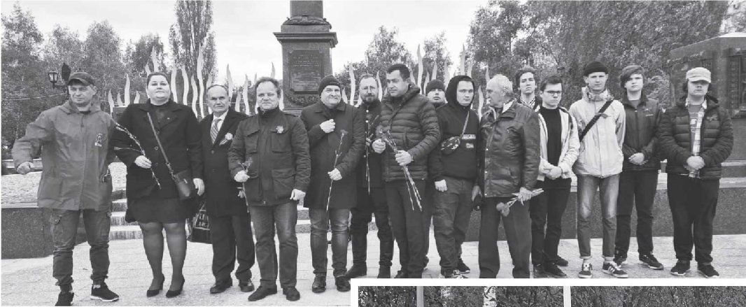
Начало на стр. 1