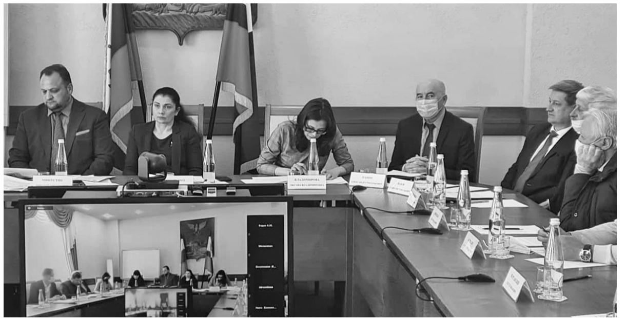
Круглый стол в Белгородской областной Думе 29 апреля «Защита прав семьи в условиях цифровой трансформации»