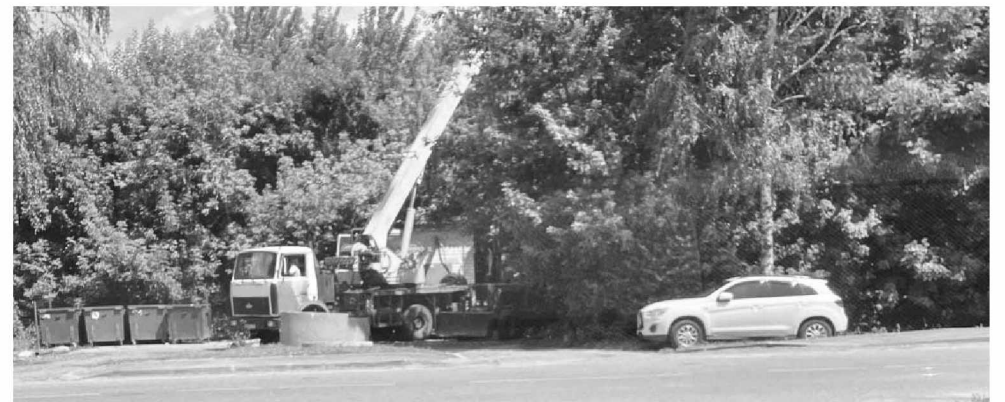
Эффект от одиночного пикета не заставил себя ждать. Уже на следующий день в поселке были установлены специальные экраны, с помощью которых теперь будет контролироваться наличие вредных веществ в воздухе и в случае превышения нормы - оперативно реагировать.