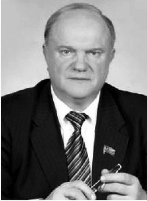
Начало на стр.1