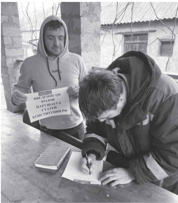
Старооскольские коммунисты собирают подписи против обязательного наличия QR-кодов у граждан для посещения общественных мест