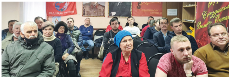
Старооскольское МО КПРФ проводит встречу с активом по сбору подписей против введения QR-кодов, а также политпросвещение