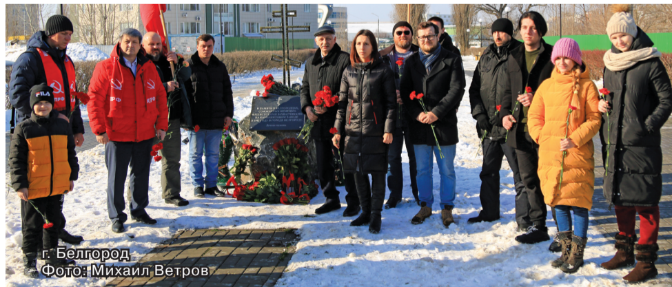
г. Белгород

Старооскольские «Дети войны» в преддверии праздника провели встречу