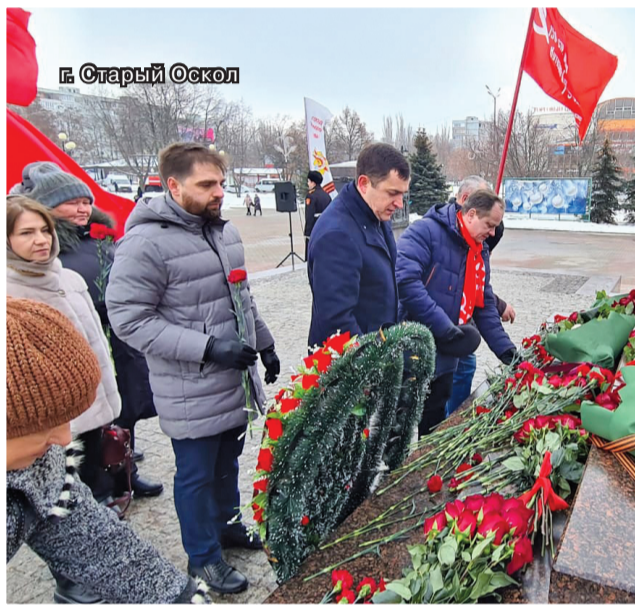
г. Старый Оскол

что спасут их от пули и после расстрела кому-нибудь из них удастся выбраться из этого ада. Но спастись не удалось никому. Заколотив досками двери сарая, полицаи облили их нефтью и подожгли.