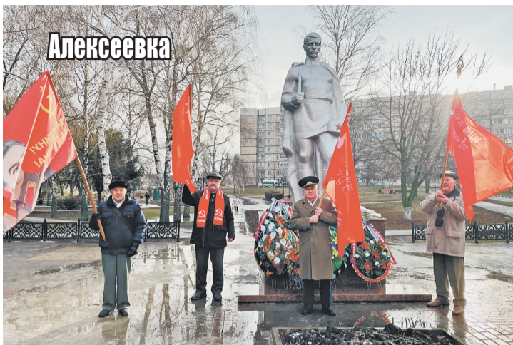
Алексеевские коммунисты широко отпраздновали годовщину освобождения

19 января 1943 года завершилась Острогожско-Россошанская операция, в ходе которой Алексеевский район был освобожден от фашистских оккупантов. В день этой памятной даты коммунисты Алексеевского района возложили венки и цветы к братским могилам и памятникам Неизвестному солдату на территории города и в ряде сёл района.