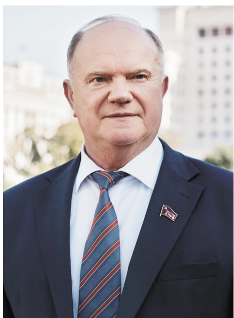
В среду, 29 марта, Председатель ЦК КПРФ Г.А. Зюганов выступил на телеканале Россия 24.

Комментируя ситуацию на Украине, Геннадий Андреевич высказал мнение, что в случае поддержки плана КПРФ и признания республик Донбасса еще в 2014 году сегодняшнего конфликта не было бы. А сегодня Запад пытается победить нашу страну, используя самые