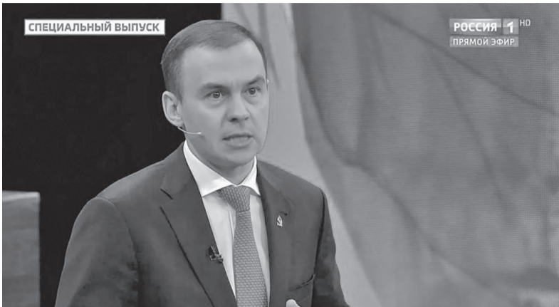
Первый заместитель Председателя ЦК КПРФ Ю. В. Афонин принял участие в программе «60 минут» на телеканале «Россия-1».

Темой обсуждения в студии стало влияние российской спецоперации на Украине на глобальную повестку. Юрий Афонин напомнил телезрителям о словах китайского лидера Си Цзиньпина, которые он сказал на встрече с президентом Путиным: «Сейчас идут перемены, которых не было в течение 100 лет». И снова тектонические сдвиги в мире запустила наша страна, отметил Юрий Вячеславович. Что было 100 лет назад? Произошла Великая Октябрьская революция, и в течение нескольких лет после нее в большинстве стран мира были созданы коммунистические партии, в том числе и в Китае. Под влиянием Великого Октября произошла значительная активизация национально-освободительного и антиколониального движения во всем мире. Гегемония Запада стала рассыпаться, и этот процесс длился около 70 лет. Только разрушение СССР