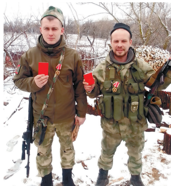
Вручение памятных медалей ЦК КПРФ нашим военнослужащим, которые отличились при выполнении боевых задач на Сватовском направлении