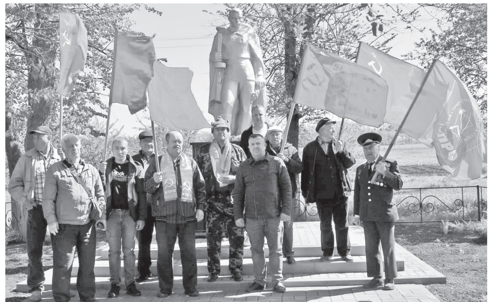
В Алексеевке прошел марш памяти о героях войны