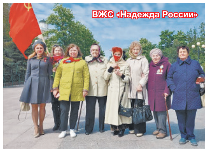
ВЖС «Надежда России»