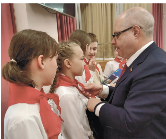
День Пионерии белгородские ребята отметили вместе с депутатом Госдумы Сергеем Гавриловым

В праздничный день - День Пионерии депутат Государственной Думы (КПРФ) Сергей Гаврилов встретился с белгородскими школьниками, которые являются членами общества глухих. Он отметил: