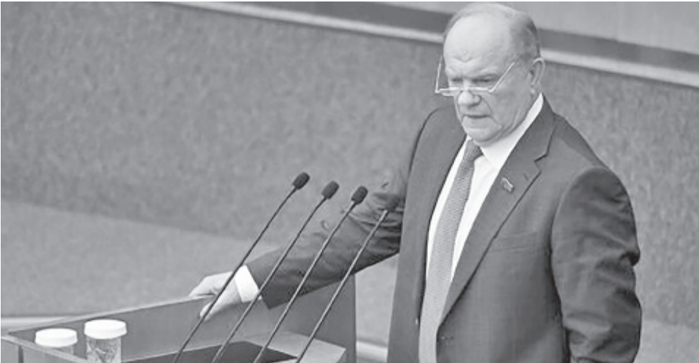
20 июня на пленарном заседании Государственной Думы выступил Председатель ЦК КПРФ, руководитель фракции КПРФ в Госдуме Г.А. Зюганов. Предлагаем вашему вниманию текст его выступления.

Я с огромным интересом следил за работой питерского экономического форума, за выступлением президента, его ответами на вопросы. Когда Председатель Думы позвонил и спросил, поеду ли я туда, я ответил: обязательно! Потому что в условиях гибридной войны на уничтожение, развязанной против России, экономические и социальные вопросы имеют такое же важное значение, как и вопросы, которые сегодня решаются на фронте. В этом зале мы приняли более сотни законов, помогающих преодолеть санкции и поддержать специальную военную операцию. Каждый день президент выступает на совещаниях. Ежедневно собирается правительство Мишустина. И очень важно было услышать, какие результаты мы получили за прошедший год.