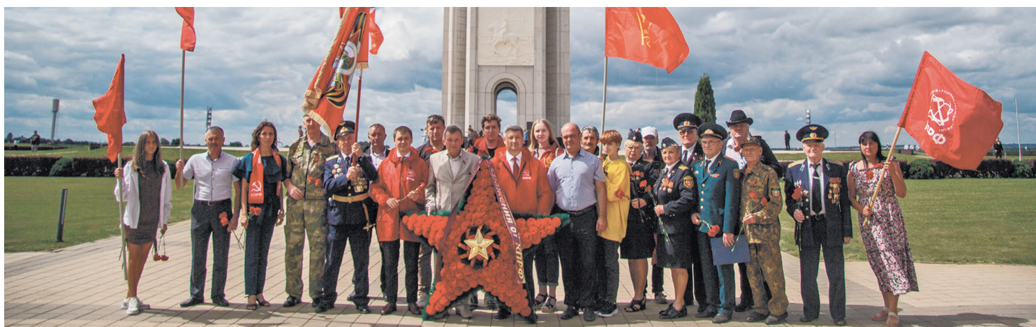
Мы чтим подвиг прохоровских героев

12 июля исполнилось ровно 80 лет со дня Прохоровского сражения. Эта самая крупная танковая битва стала решающей для нашей Великой Победы.