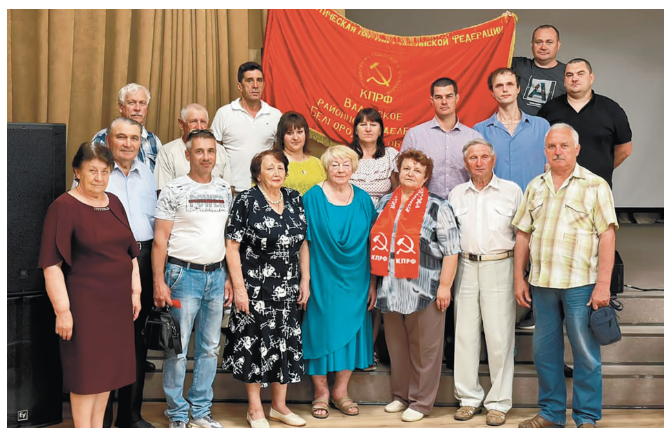
Коммунисты Валоек после Пленума по выдвижению кандидатов в депутаты