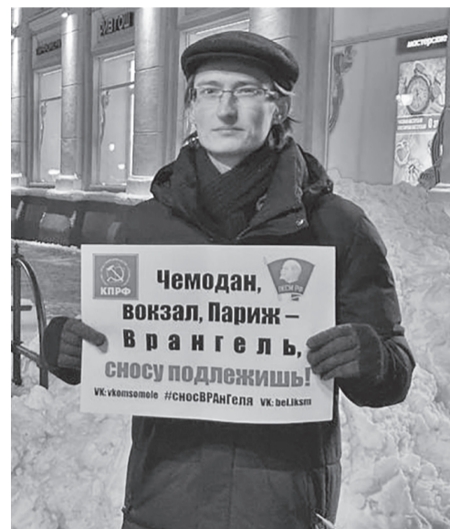
Белгородские комсомольцы приняли участие в общероссийской акции протеста за демонтаж памятника «Черному барону» - провели серию одиночных пикетов в оживленных местах Белгорода

Правоохранителям предстоит выяснить, как силы, воспевающие лидеров нацизма, сумели воскреснуть в наши дни и привнести раздор на донскую землю. Ростовские коммунисты заявили, что будут пристально следить за снесённым бюстом, чтобы тот не получил шанса на возрождение, как мемориал военному преступнику, группенфюреру СС, атама-