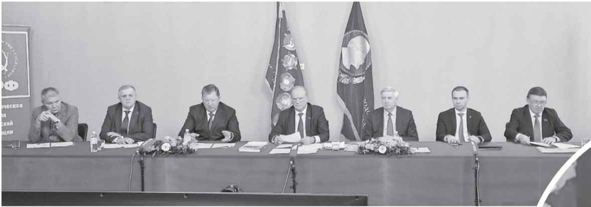
Начало на стр.1

Здесь собрано все, начиная от первых декретов Советской власти, до великой ленинско-сталинской модернизации, нашей победы в Великой Отечественной войне и в космосе, что демонстрирует выдающееся торжество ленинских идей.