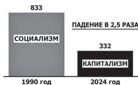
Производство сливочного масла, тыс. т