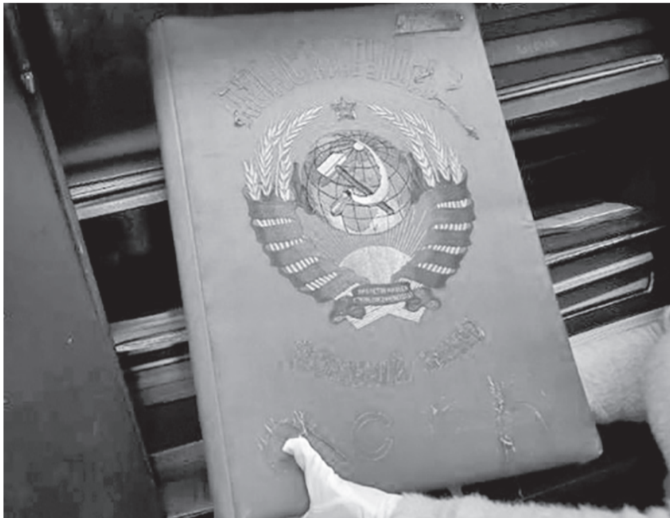
Конституция СССР 1936 года ручной работы, подаренная Иосифу Сталину активистками Совета жен Ленинградского техникума железнодорожного транспорта им. Ф.Э. Дзержинского

Ответ — в той же сталинской Конституции, в статье 6: «Земля, её недра, воды, леса, заводы, фабрики, шахты, рудники, железнодорожный, водный и воздушный транспорт, банки, средства связи, организованные государством крупные сельскохозяйственные пред-